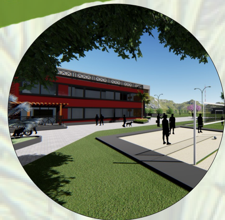
ESPAÇO DE CONTEMPLAÇÃO COM A NATUREZA