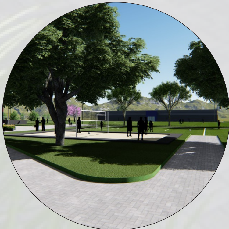
QUADRA DE VÔLEI DE AREIA E CAMPO DE FUTEBOL